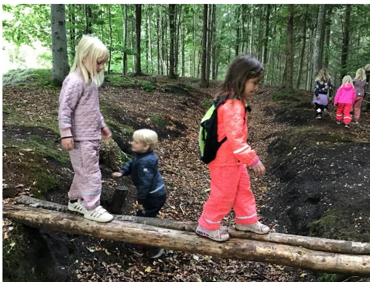
Der øves i at gå balancegang

Vi forsøger at lave aktiviteter hvor kroppen både er i bevægelse og ro. Personalet har kendskab til aktiviteter både i høj og lav intensitet – bl.a. sanglege, massage lege, afslapning og "fryd leg".