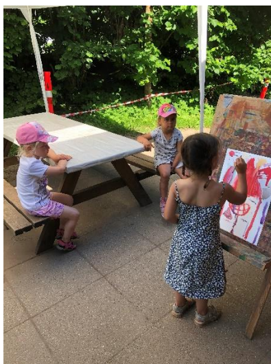
Pigerne venter på det bliver deres tur til at male deres kunstværk

I børnehaven tilbyder vi børnene et bredt udvalg af fælles oplevelser, der stimulerer kreativiteten, fantasien og skaber glæde, samt giver inspiration til at lege, skabe og eksperimentere med de kulturelle udtryksformer, de møder.