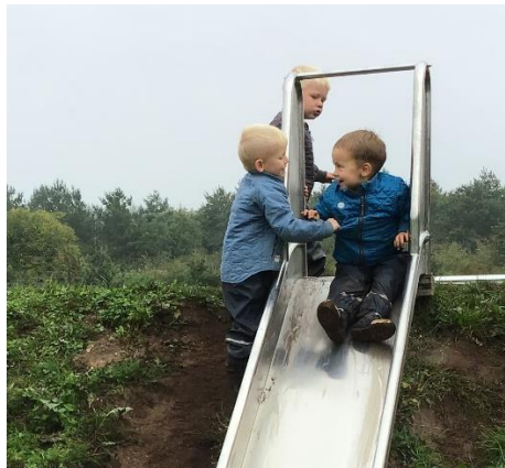
Tre gode venner hygger på en legeplads nær børnehaven

En større gruppe piger leger "mor, far, børn" på legepladsen. Alle piger har en rolle i legen, kom der flere til, blev der hurtigt i fællesskab fundet en ny rolle så alle kunne være med. Der blev forhandlet om legens indhold og legen udviklet sig over flere dage.