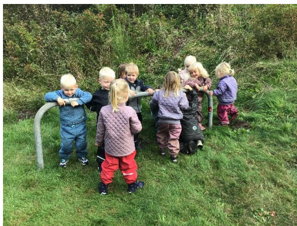
De yngste børnehavebørn leger på et grønt område nær børnehaven

Derudover samarbejder vi med skolen, omkring det der er muligt, og vi benytter os af forskellige kulturelle tilbud på biblioteket og på VIA.