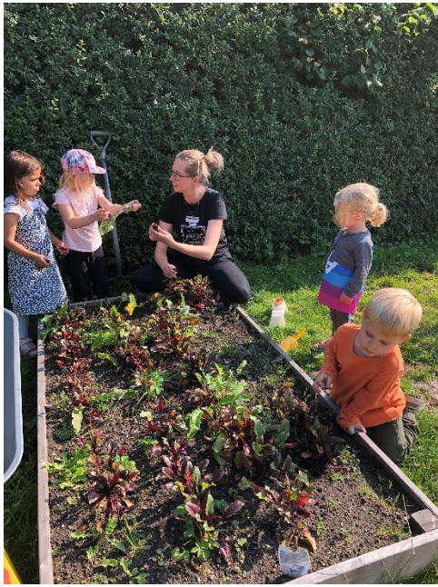
Vi høster vores egne rødbeder

I børnehaven har vi en science tilgang, hvor det pædagogiske personale tilrettelægger læringsmiljøet, så det giver børnene mulighed for at eksperimentere og undersøge samt skabe erfaringer med forskellige årsager og sammenhænge. Der tages udgangspunkt i et læringssyn, hvor vi inddrager børnenes viden og erfaringer samt undren og naturlige nysgerrighed.