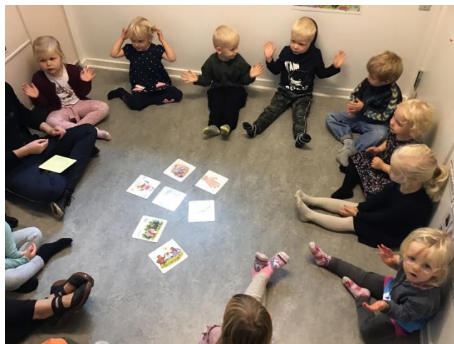
De yngste børn i børnehaven holder samling

I Engelsborg Børnehus har vi iPads, som vi bruger sammen med børnene som redskab til inspiration, videnssøgning, til at tage billeder desuden bruger vi iPadsene som et redskab til f.eks. at lave e-bøger om forskellige emner og aktiviteter.